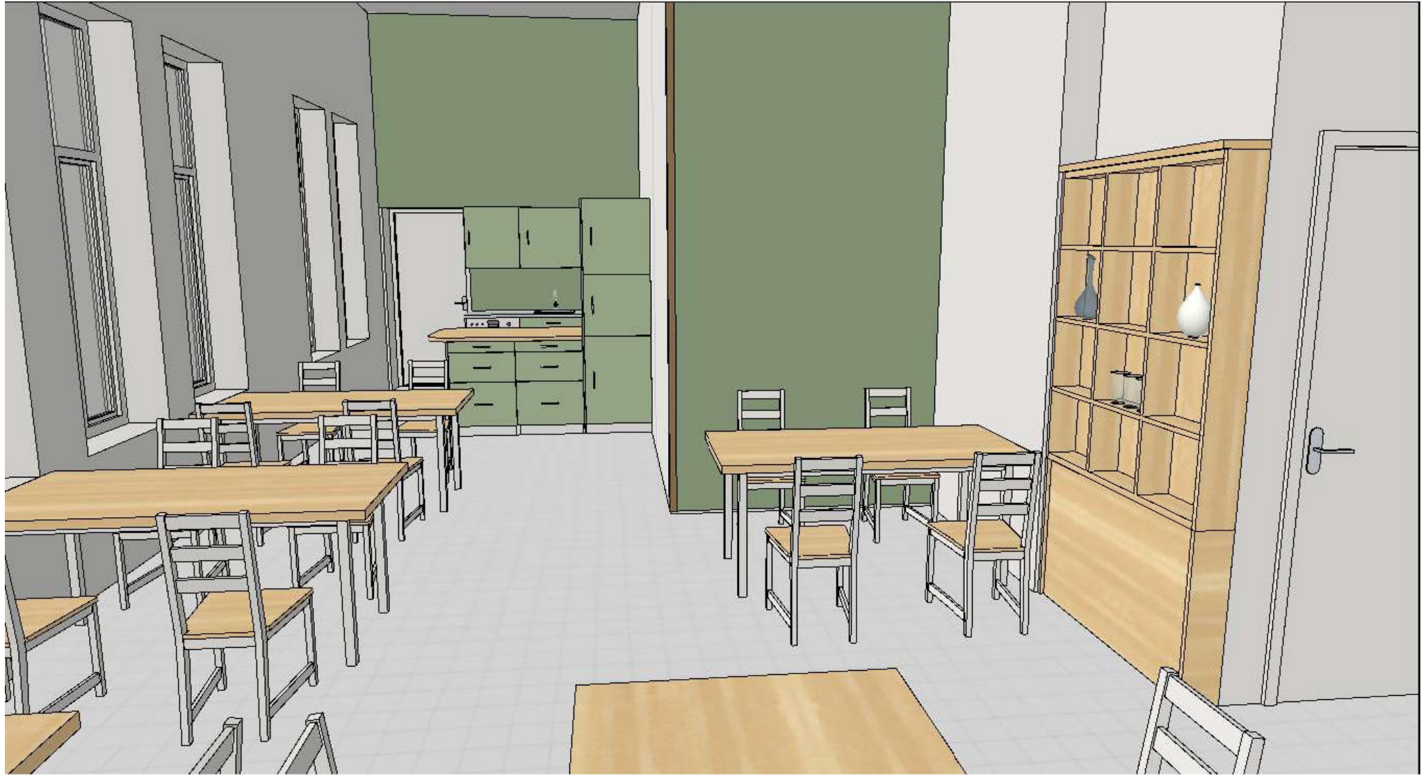
Uusi kahvila/Ny café