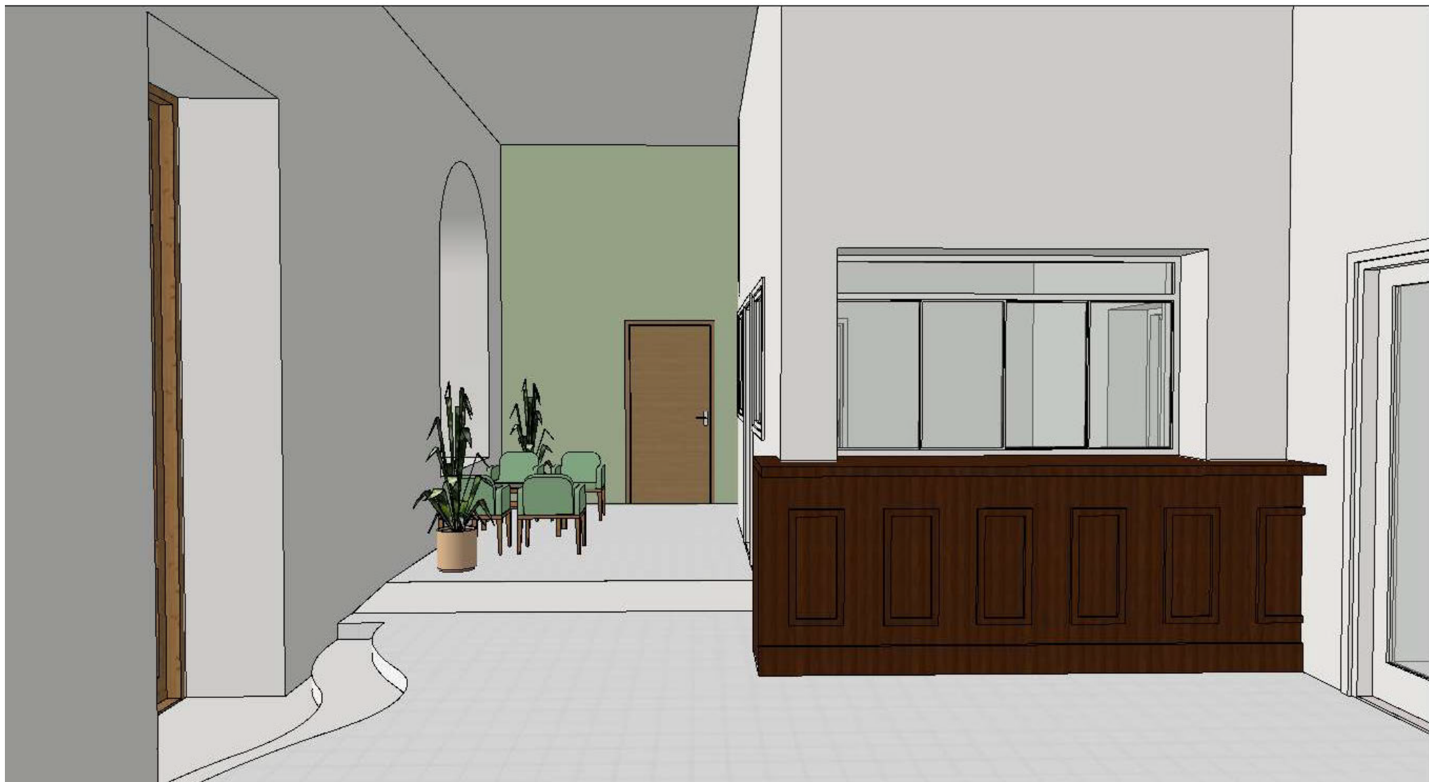
Uusi aula/Ny foajè